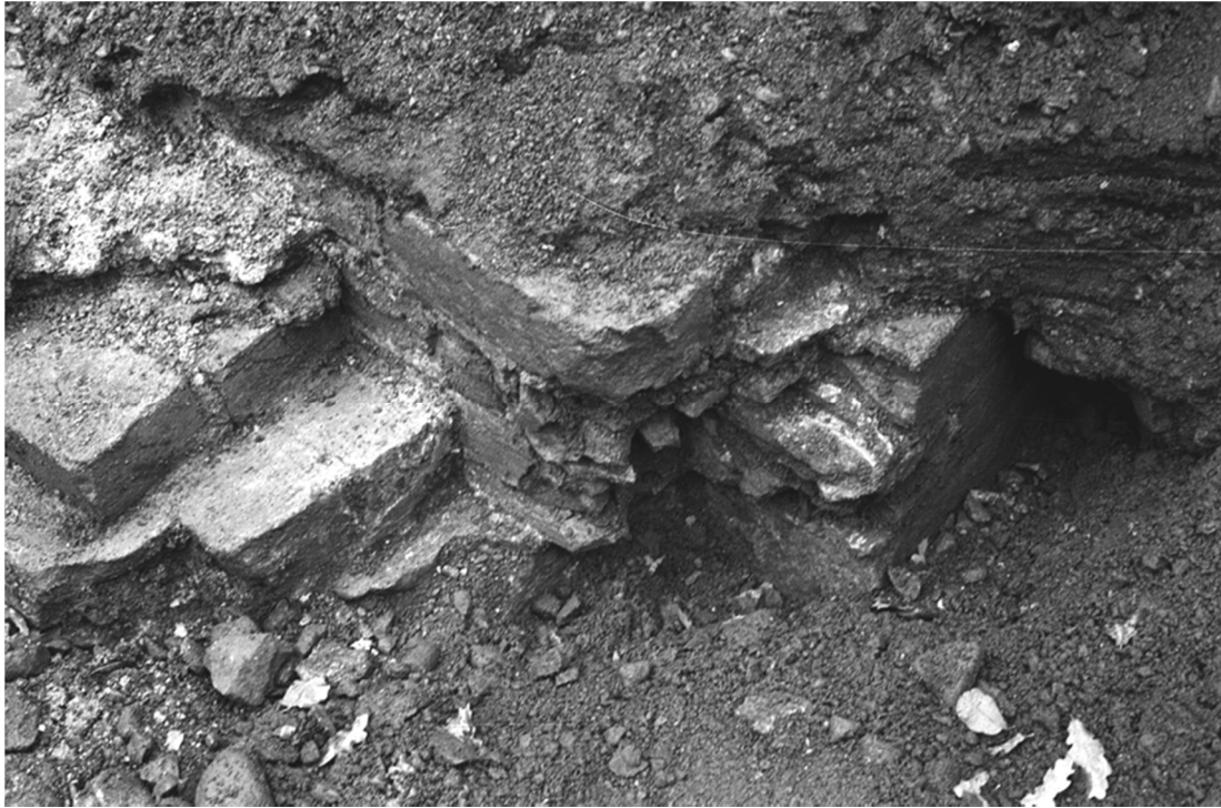
Foto 6. Sakristians Ö mur, rester i bottenvåningens (sakristians) plan. T.h. försvinner dess inre murliv in i jordmassorna. Strax t.v. därom finns ett vinkelrätt murliv genom muren, troligen S sidan av den öppning där den svängda trappan från cellariet mynnat. Foto fr. NV.