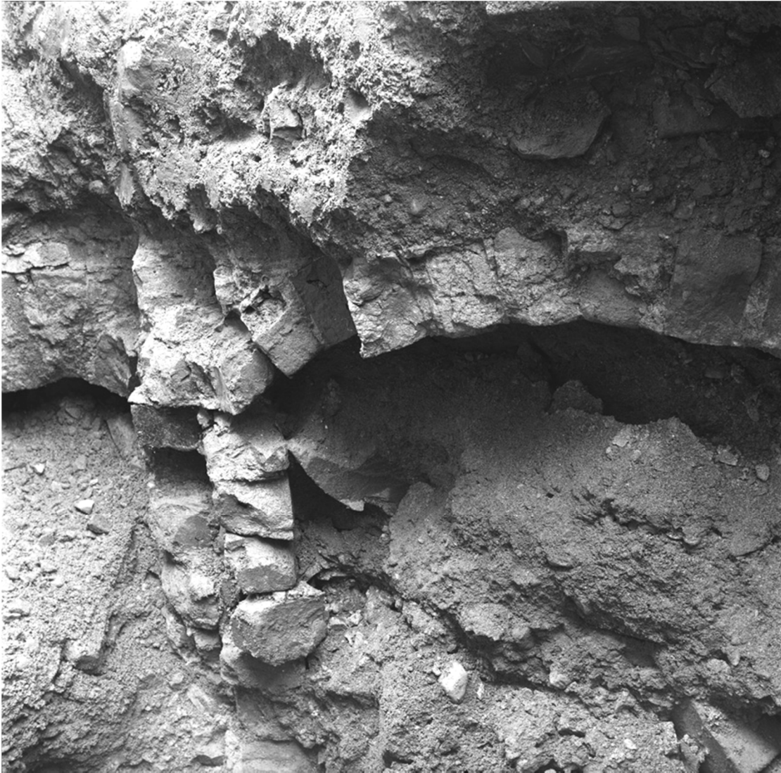
Foto 4. Korridorens genombrutna valv fr. Ö.