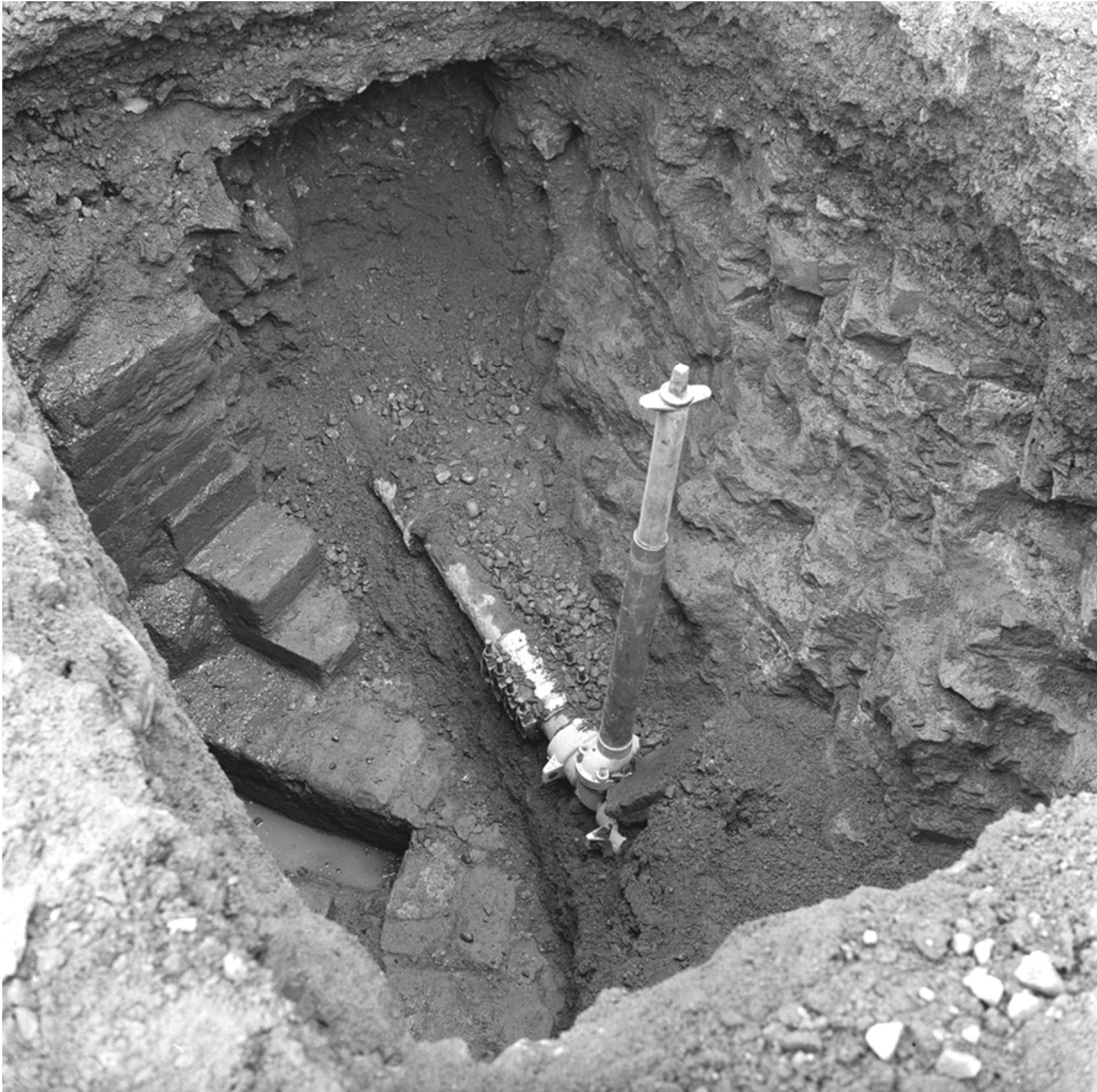
Foto 5. T.h. om ledningen genomhuggen mur (källarens Ö vägg).