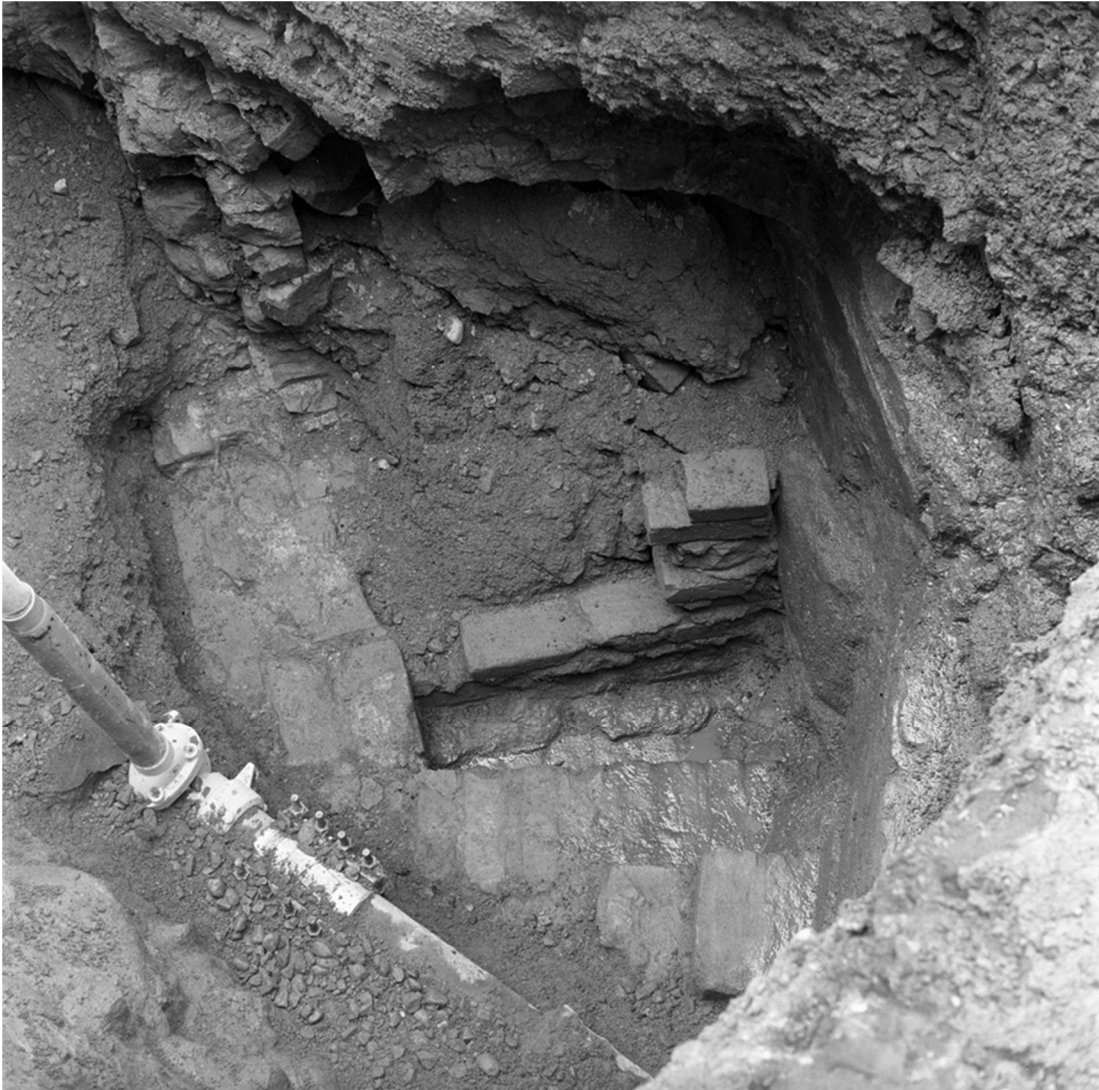
Foto 2. Samma motiv som föreg., foto fr. SO. I mitten ses resterna av den tunna tegelvägg som utgjort igensättning mellan källarens korridor och trappan. Framför igensättningen ses resterna av trappan. Omgivande murar är raka fram till trappans krök, där den högra (norra) muren böjer av mot SO.