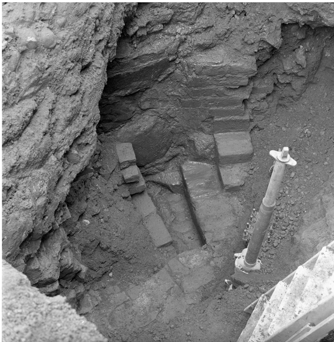
Foto 1. Trappan med omgivande murar, foto fr. S. T.v. ses igensättningens tunna tegelvägg. T.h. därom ses de tre konstaterade stegen i den svängda trappan. I förgrunden den raka södra muren, i bakgrunden den därmed parallella norra muren som strax innanför igensättningen viker av mot SO.